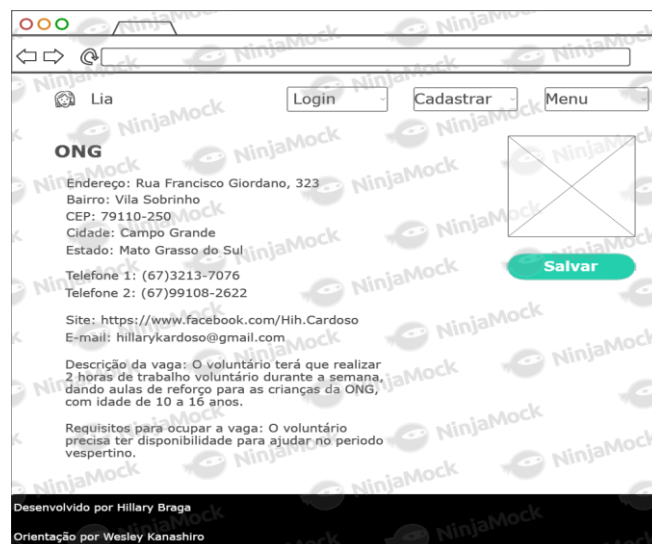
Figura 1 - Protótipo de tela da instituição.

Ademais, os protótipos das telas de navegação do website foram construídos, pois além de servir como base, é a maneira mais rápida, eficaz e fácil de validar uma ideia. Dessa forma, pôde-se definir as posições de alguns elementos principais, como algumas figuras, botões, campos de texto, entre outros (Figura 1).